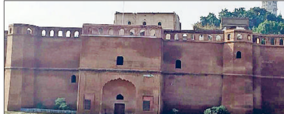
कैथल। कैथल का ऐतिहासिक भाई उदय सिंह का किला।

स्थानीय लोगों ने 13 नवंबर 1240 अभी भी कैथल में स्थित है। सिख गुरु हरि ने तत्कालीन राजा भाई देसु सिंह को भगत के प्रतीक के रूप में सम्मानित किया, उसके बाद कैथल के प्रशासक को भाई के रूप में और 1843 ई.पू. भाई उदय सिंह कैथल पर शासन कर चुके थे और आखिरी राजा के तौर पर सिद्ध हुए थे। 14 मई 1843 को भाई उदय सिंह का निधन हो गया। कैथल के लोगों ने 1857 में स्वतंत्रता संग्राम में सक्रिय भूमिका