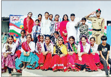
कैथल। हरियाणा दिवस पर राधा कृष्ण सीनियर सेकेंडरी विद्यालय के विद्यार्थी। !