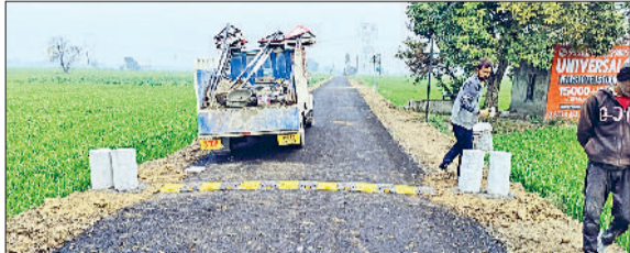
कैथल। कैथल में चल रहा सड़कों का निर्माण कार्य

2025 में मिले मार्केट कमेटी को मिले गए चेयरमैन 36 साल का हुआ कैथल- ऐतिहासिक शहर शिक्षा स्वास्थ्य सहित हर क्षेत्र में तेजी से कर रहा तरक्की