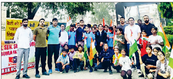
गुहला चीका। एकता के लिए दौड़ में भाग लेते गुहला स्कूल के विद्यार्थी।

दिवस हमें अपनी जड़ों से जोड़ता है और गर्व करता है कि हम उस भूमि के वासी हैं जहाँ परिश्रम, संस्कृति और वीरता का संगम है। हरियाणा की संस्कृति को आत्मसात करते हुए आगे बढ़ने और राज्य तथा देश का नाम रोशन करने के लिए प्रेरित किया। इस मौके पर शिक्षक भी मौजूद रहे।