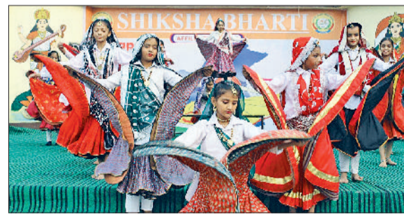
शिक्षा भारती मॉडल स्कूल में कार्यक्रम में हरियाणवी डांस प्रस्तुत करती छात्राएं।